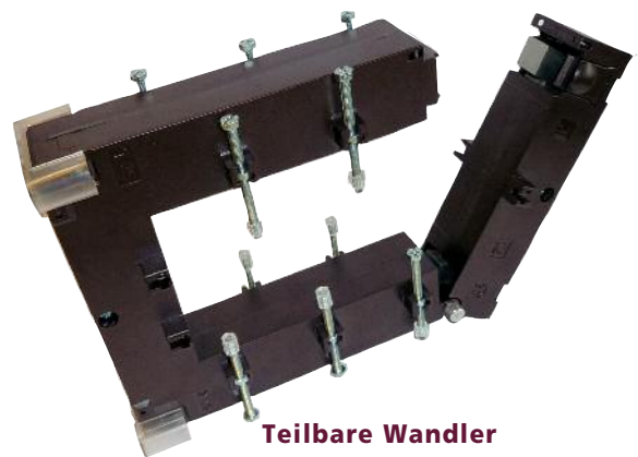
Teilbare Wandler Open-core